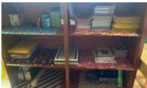
Gambar 2. Media dan Bahan Ajar yang digunakan

“Pembelajaran biasanya memakai metode ceramah sama penugasan. Siswa diminta untuk membaca teks cerita dari buku paket, terus nanti mengerjakan soal yang ada pada buku. Biasanya setelah mengerjakan soal saya mengajak siswa membahas soal yang sudah dikerjakan.”